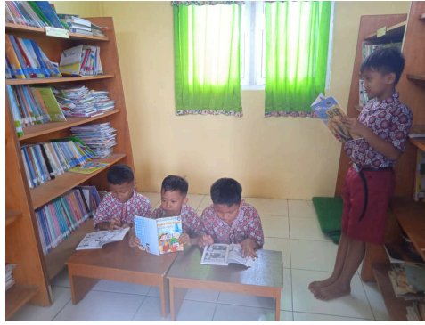
Gambar 2. Literasi Membaca di Perpustakaan