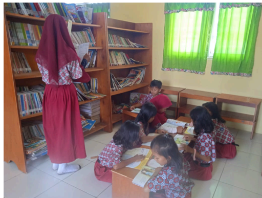
Gambar 3. Literasi Membaca di Perpustakaan

Literasi membaca di perpustakaan untuk meningkatkan upaya minat baca siswa kelas IV. Guru mengajak siswa untuk mengunjungi perpustakaan selama dua minggu dengan waktu 30 menit per harinya. Saat di perpustakaan siswa dapatkan kesempatan untuk melihat buku-buku yang terdapat di perpustakaan. Jika siswa merasa tertarik pada buku tersebut siswa dipersilahkan untuk mengambil dan membaca buku tersebut. Siswa dibiasakan untuk tertib membaca di perpustakaan, seperti membaca buku dalam hati tidak dengan mengeluarkan suara, tidak saling mengganggu temannya, tidak merusak buku, mengambil serta mengembalikan buku dengan rapi. Perpustakaan tentunya banyak buku menarik tidak hanya buku pelajaran saja, tetapi terdapat buku cerita buku tentang cara-cara menanam tanaman dan lain sebagainya. Siswa sangat bersemangat karena banyak buku-buku baru, siswa juga bersemangat membaca karena tertarik dengan gambar-gambar yang terdapat di buku tersebut.